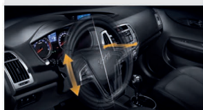
فرمان تلسکوپ با قابلیت تنظیم دستی