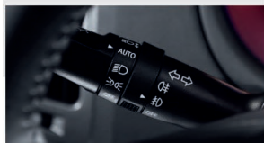
کلید اتوماتیک روشن و خاموش شدن چراغ ها (Auto Light)