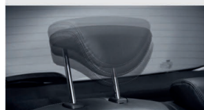
تنظیم ارتفاع پشت صندلی های ردیف عقب