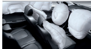
۶ کیسه هوای ایمنی ( دو عدد جلو - ۲ عدد جانبی - ۲ عدد پرده ای )