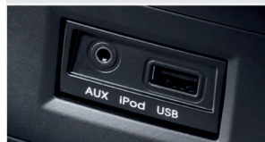
دارای پورت iPod ، USB و AUX