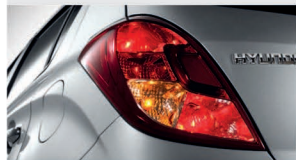
چراغ ترکیبی عقب