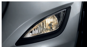
مه شکن جلو