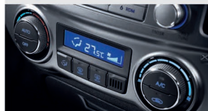
سیستم تهویه مطبوع اتوماتیک