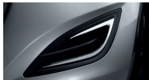
کاور مه شکن