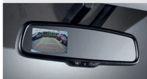
آینه الکتروکرومیک و دوربین عقب قابل رویت بر روی آینه