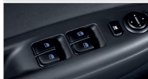
کلید کنترل بالابر شیشه ها