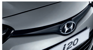
جلو پنجره ۶ ضلعی