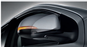
آینه های جانبی با قابلیت تنظیم و کاهش ضربه