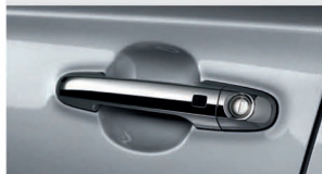
دستگیره های کروم