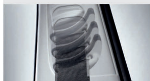
تنظیم ارتفاع کمر بند