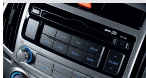
سیستم صوتی با روکش مشکی (High Glass)